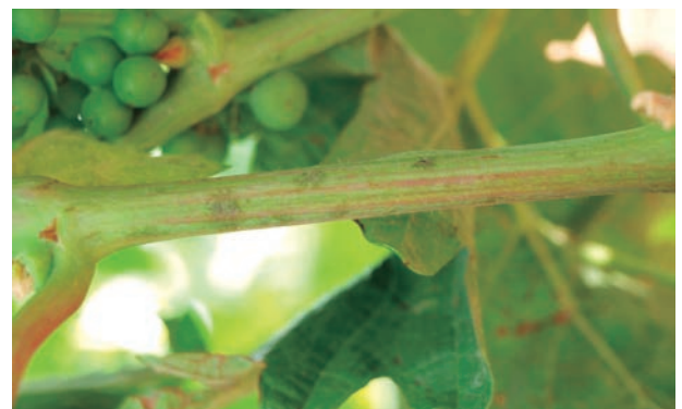
Primeros ataques en brote

La línea roja representa el riesgo acumulado de oídio para la parcela Baretón en el periodo 10 de junio a 31 de agosto de 2021. En los puntos donde el riesgo es de valor nulo corresponde a tratamientos aplicados. El riesgo el día de la aparición de oídio es 60 (Alto), pero el modelo marcaba valores superiores a 90 (extremo) desde el 4 de agosto.