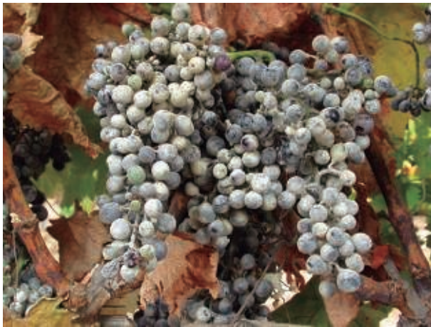
Oídio en Racimo