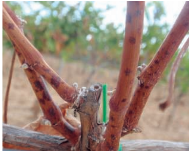
Oídio en invierno

Dicha ficha se informatizó para poder tomar datos en campo mediante una sencilla aplicación digital adaptada a móvil. Mediante esta herramienta digital, se anotaban los datos de síntomas de oídio en hoja y racimo, con georreferenciación automática. También se almacenaban de forma automática en el servidor para su posterior análisis y tratamiento de la información.